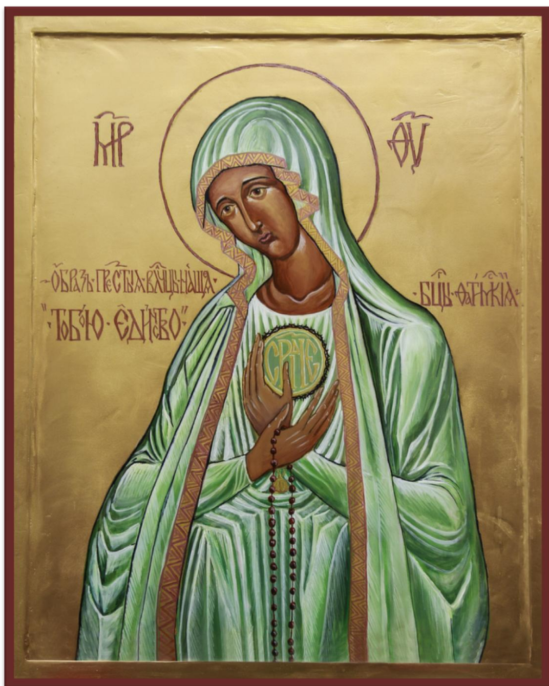
ICONO DE LA MADRE DE DIOS DE FÁTIMA DEL APOSTOLADO MUNDIAL DE FÁTIMA DE CÓRDOBA QUE SE VENERA EN LA PARROQUIA DE LA INMACULADA C. Y SAN ALBERTO MAGNO